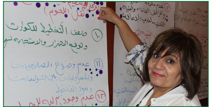
مواطنة من بيت لحم أثناء ورشة عمل التخطيط الإستراتيجي

حيث أن هذه الجهود تضمن أن تكون الخطط التنموية الإستراتيجية (SDIP) ووافق حية تقوم على التنمية المحلية في البلديات الشريكة، فقد ساعدت لجان دعم التخطيط الإستراتيجي في بلدية بيت جالا على ضمان 50% من مشاريع الخطط التنموية الإستراتيجية المقترحة أن تعكس ميزانية عام 2013 من أجل تحسين المعيشة على أن يتم تنفيذ المشاريع المحددة من المجتمع على أنها ذات أولوية.