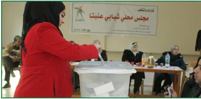
انتخابات المجلس المحلي الشبابي في عنبتا

يطمح برنامج الحكم المحلي والبنية التحتية (LGI) إلى إنشاء آليات مختلفة لتسهيل انخراط الشباب من كلا الجنسين في مجتمعاتهم المحلية، ومن إحدى هذه الآليات هي المجلس المحلي الشبابي (YSLC) وهو عبارة عن هيئة منتخبة ديموقراطياً تعكس تكوين ومهام وأدوار المجلس المحلي في المجتمع، حيث عقدت مؤسسة مجتمعات عالمية بالشراكة مع منتدى شارك الشبابي حتى الآن 18 جولة انتخابات بمشاركة أكثر من 6,500 شاب، فبمجرد الإنتهاء من الانتخابات، يعمل أعضاء المجالس مع البلديات المعنية والجمعيات العامة للشباب لقيادة المبادرات المحلية بما في ذلك تجميل وتحسين البيئة وجمع الأموال للمنظمات غير الحكومية المحلية وأنشطة تطوعية الأخرى.