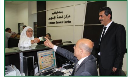
مواطنون يستخدمون خدمات مراكز خدمة الجمهور في الضفة الغربية